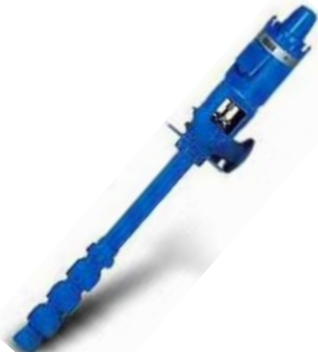
Turbinas Verticales Varios

Todos los voltajes/ Frecuencias y Armazones