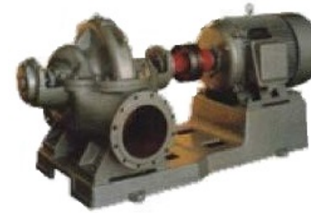
Junta Cubierta Horizontal

Todos los tamanos y metalurgia (API-610 & ANSI)