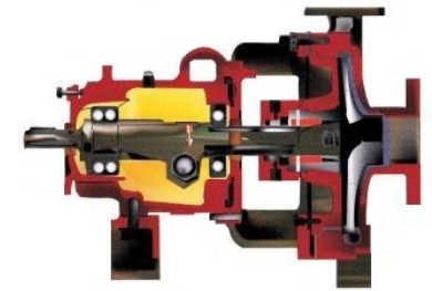
ANSI-Bombas Para Process Quimico

Todos los tamanos y metalurgia (API-610 & ANSI)