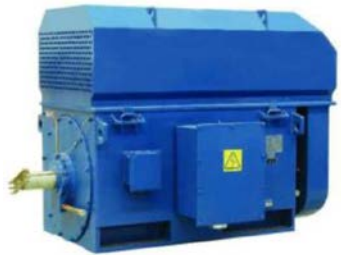
YKK Hasta 12000HP Compresor / Motores Duty Marino

INGENIERIA INVERSA COMPLETA PARA TODAS BOMBAS Y PARTES. MAS DE 5 DECADAS DE SUMINISTRAR PRECIOS COMPETITIVOS EN BOMBAS Y PIEZAS MAS DE 70,000 DIBUJOS Y PATRONES UTILIZADOS PARA FABRICAR PIEZAS PARA TODA METALURGIA Y FORROS ELASTOMEROS INVERSION DISPONIBLE ALTA INYECCION A PARTES EN VOLUMEN