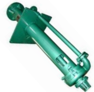
Bombas Verticales MP Para Lodos en Sumideros