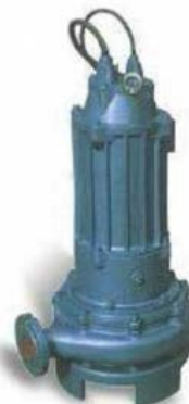
Bombas MP Sumergibles para Lodos

Doble compensacions y muchas otras. Cumple con FM