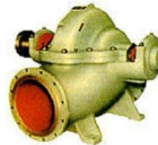
Bomba MP Para Fuegos Verticales y Horizontales

Metal Duro y Cubierta de Hule. Desague de Minas/ Residuos de Colas