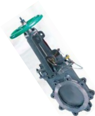
Valvulas de Mariposa HP MP De Alto Rendimiento

Metal Duro y disenno doble cubierta forrado de Hule. Expulsor Glandula Seca y Sellos Mecanicos